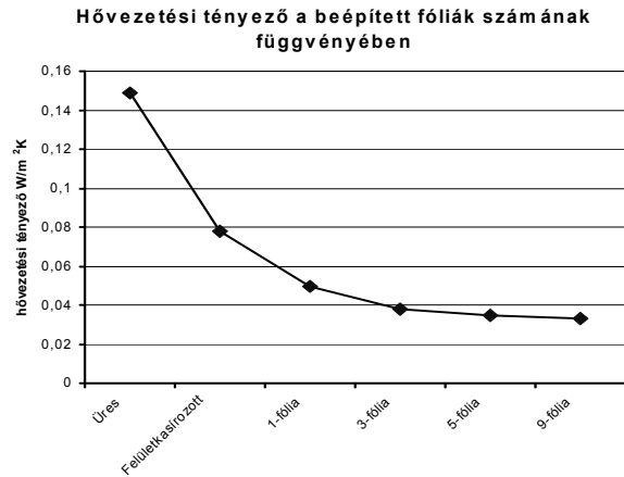
3. ábra – Tükörpanel kísérletsorozat eredményei

A hővezetéssel nem áll fenn ez a kedvező eset, mert amíg a tér két szemben lévő felülete között hőmérsékletkülönbség van és a térben levegőmolekulák vannak jelen, addig a hőmozgás következtében a levegő adott hőmérsékleti tartományhoz tartozó hővezető hatása is érvényesül. A 3 mm-es tükörpanellel jelentősen jobb hőszigetelő hatás érhető el, mint a szokványos hőszigetelő anyagokkal. A hőszigetelő hatásban mutatott javulás 30,55%. Ez azt is jelenti, hogy ilyen rendszer alkalmazása esetén